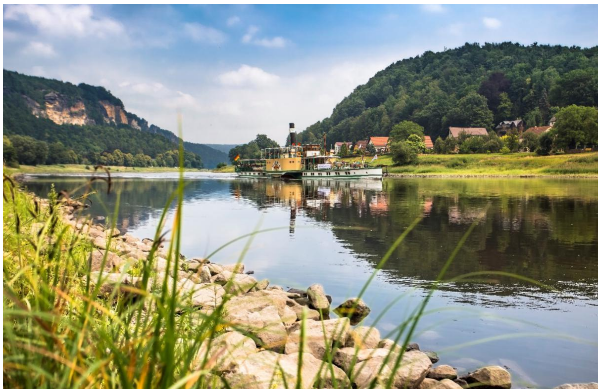
Schaufelraddampfer auf der Elbe fährt durch die Sächsische Schweiz