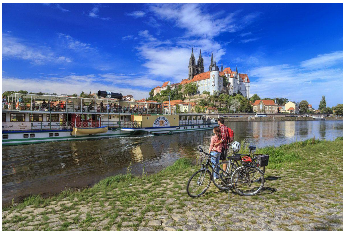
Schloss Albrechtsburg in Meißen.