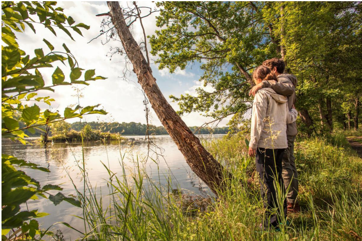
Oberlausitzer Heide- und Teichlandschaft.