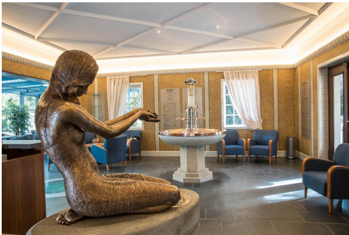
Wettnquelle im Vogtland.