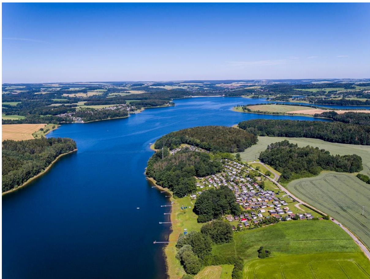
Blick auf die Talsperre Pöhl.