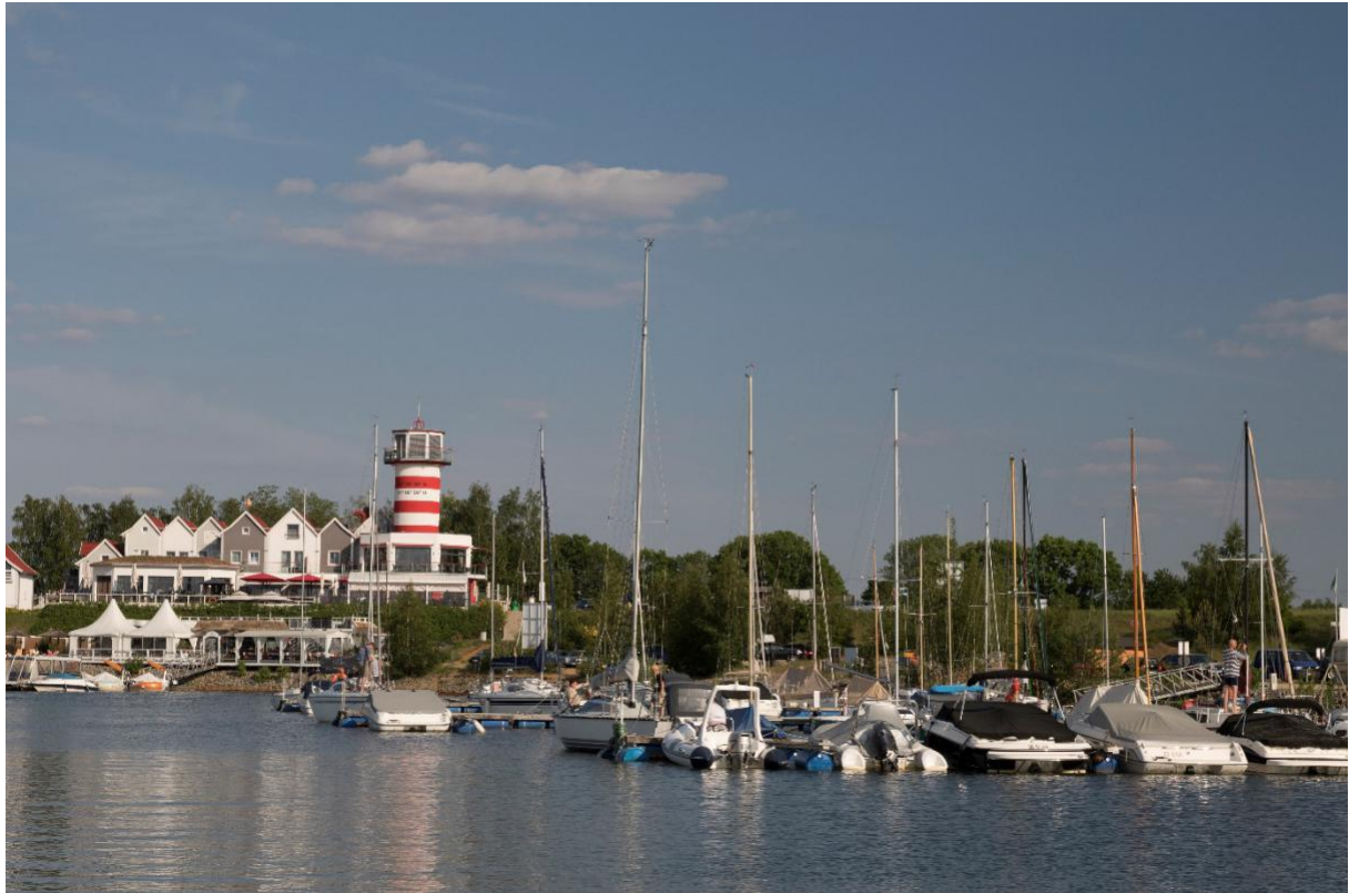
Leuchtturmhotel am Geierswalder See.