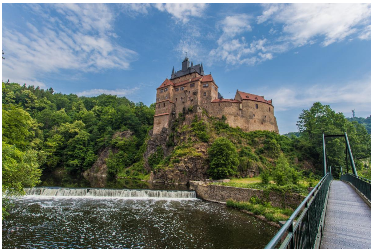
Burg Kriebstein mit Wasserfall im Chemnitz-Zwickau-Muldental.