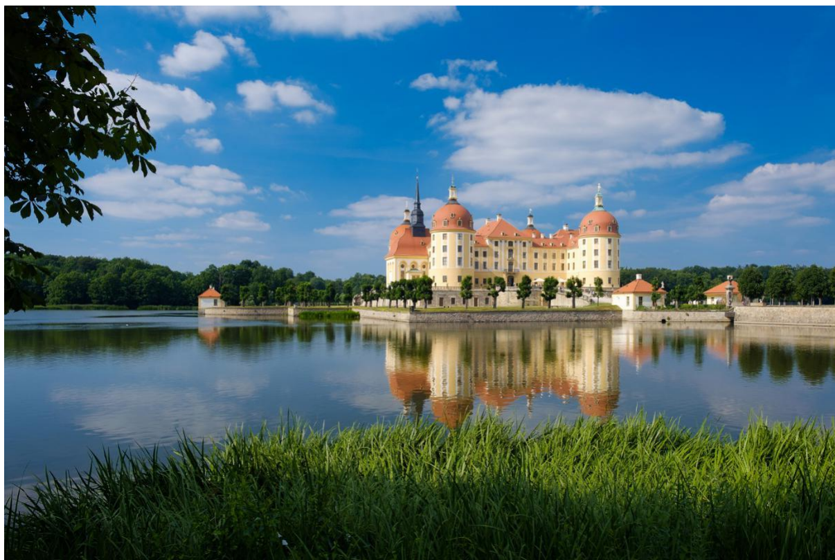
Schloss Moritzburg.